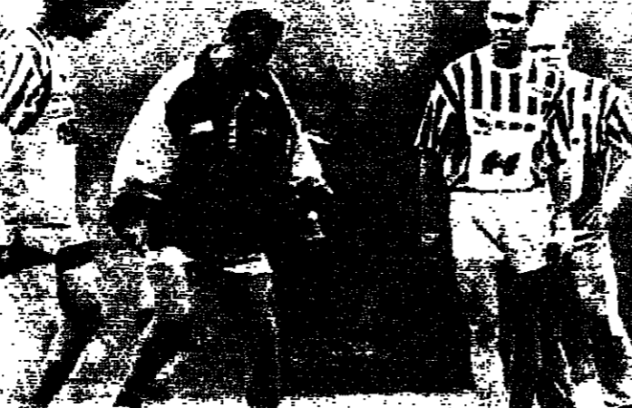
مرب النمسا هير سبرغر يحيى التهنيتات ليوسترو وروداكس

استعدت ألمانيا الغربية المرشحة للفوز بكأس العالم بعد ان سقطت يوغوسلافيا ١/٤ للقاء منتخب دولة الإمارات العربية المتحدة المتواضع المستوى اليوم الجمعة. وكان منتخب الإمارات وهو من الدول التي تلقى خارج نطاق المنافسة على البطولة قد توقع منذ زمن طويل قبل انطلاق البطولة ان يهزمه أمام ألمانيا الغربية. قال مدرب المنتخب ان الاثنان قد يتسبون ١/٠ صفر.